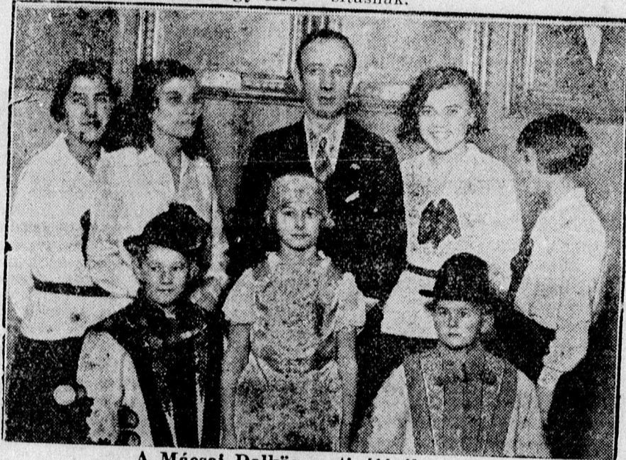
A Mácsai Dalkör matinéről.