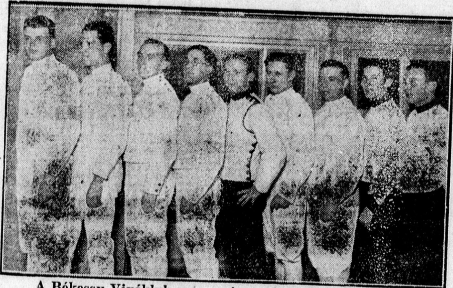
A Békessy Vivóklub versenyén. — A férfi vívók.

esapkod, csak akkor vág elő, ha erre alkalma nyílik; védeési biztosak és mellett szívós küzdő. Pestre való áthelyezésével az ország első vívói között lesz a helye. Ezzel a szép győzelmével a „Club örökös bajnoka” címet is megszerezte.