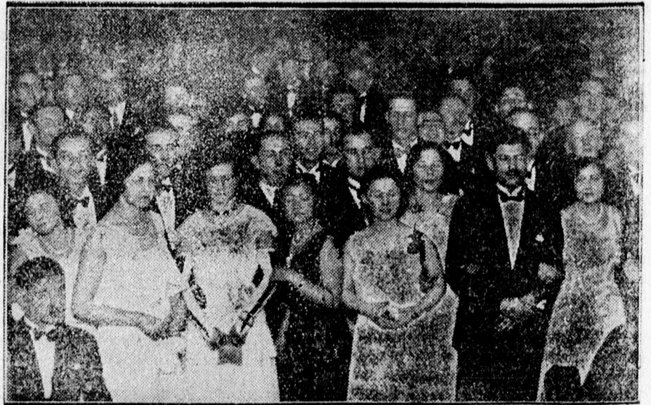
Az Izraelita Nőegylet estélyén a közönség egyrésze.