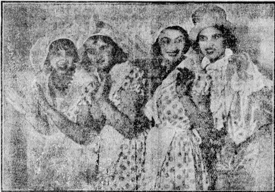
Az Izraelita Nőegylet estélyéről. A táncrevue bécsi táncának szereplői.

Debrecen, Piac u. 9. Elsőrendű reggeli, ebéd, uzsonna, vacsora