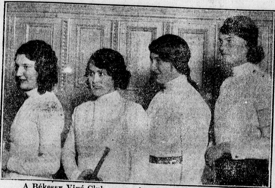
A Békessy Vivó Club versenyén a hölgyversenyzők.