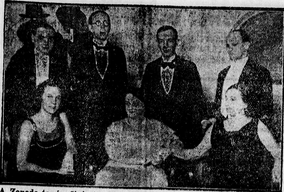
A Zenede tanárnői és tanárai, akik az inségakelő javára rendezett hangversenyen szerepeltek.