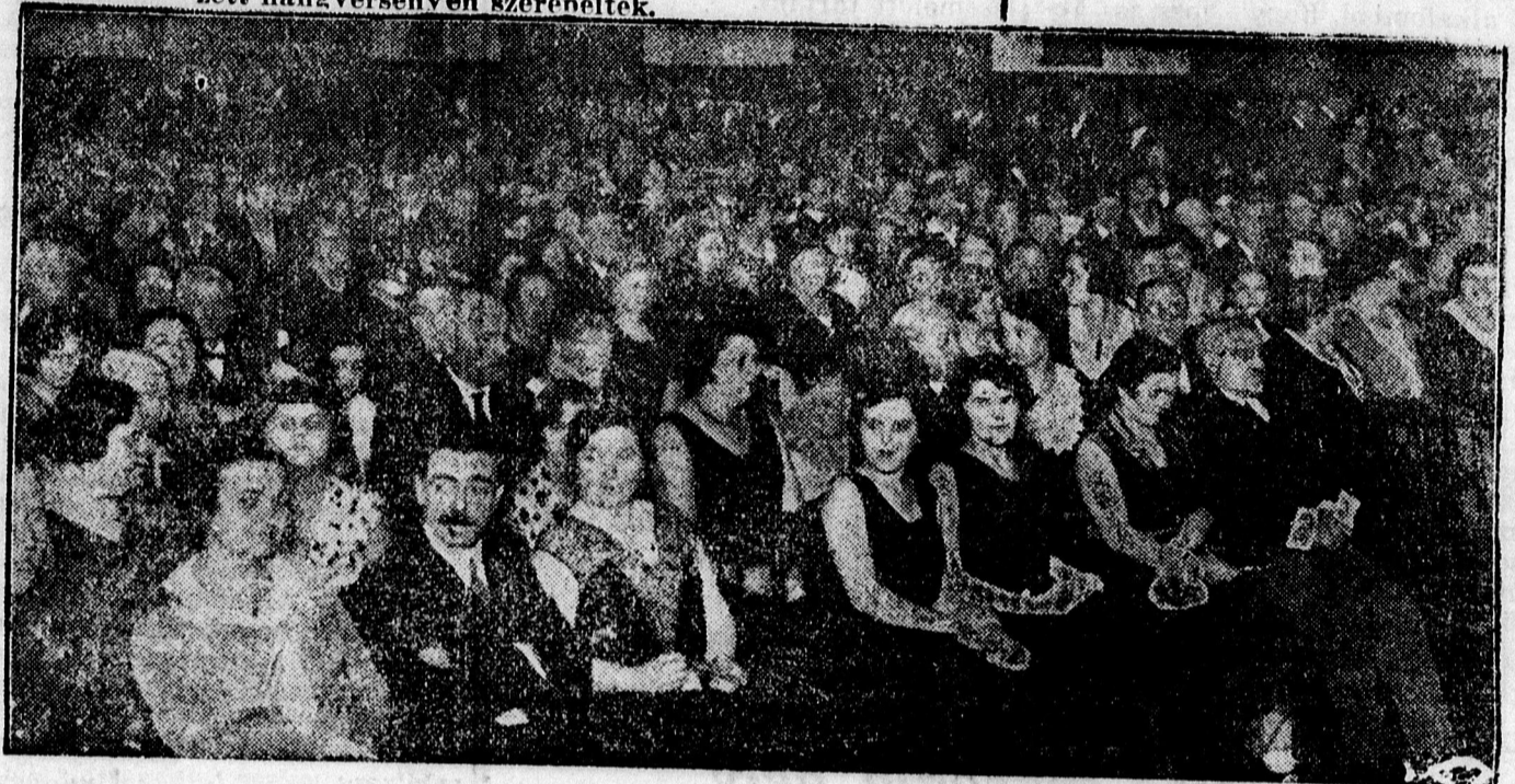
A hangverseny közönsége.