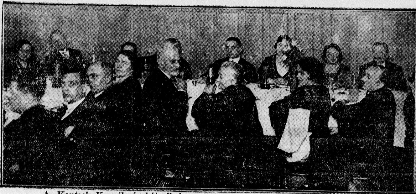
A Kontsek Kornél-cég két alkalmazottjának 25 éves jubileumi vacsorájáról.

értetni s a közös jóért, célért lelkesedéssel dolgozni tudó főnök, s alkalmazottak seregének áldásos és eredményes munkáját méltatta.