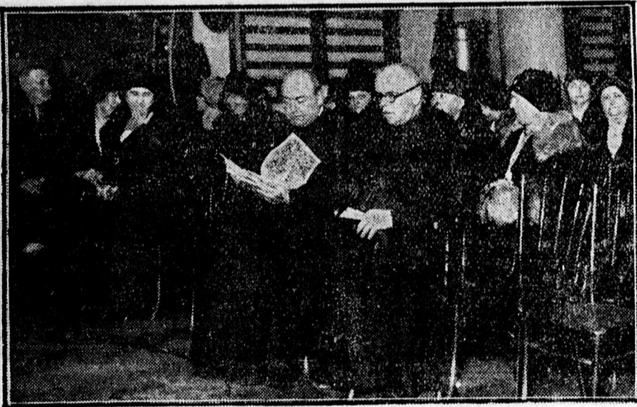
A Svetits volt iskolatársak szövetségének előadásáról.