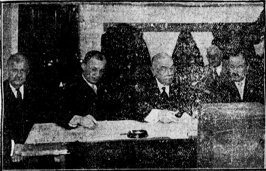
A Miklós utcai körzet szavazatszedő bizottsága.