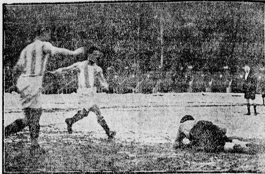
A Hungária—Slávia meccsről. — Planicka véd.