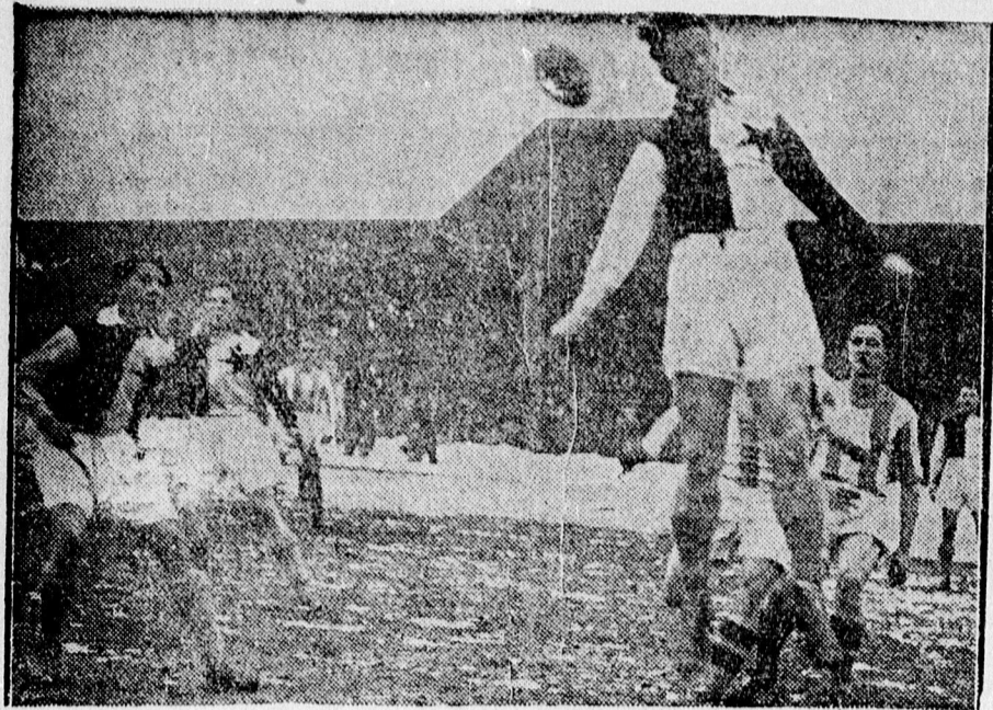
A Hungária—Slávia meccsről. Veszélyes helyzet a Slavia kapu előtt.