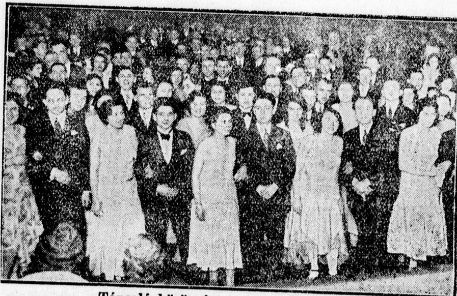
Táncoló közönség a dalosbálon.