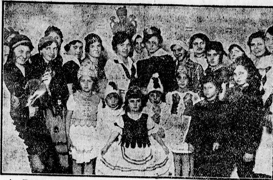
A »Bethlen Kata« cserkészcsapat farsangi előadásáról a szereplők.

Kaposvárról jelentik: Dombóvár közelében kiaradt a Kapos folyó és a környező házakat elbontással fenyegeti.