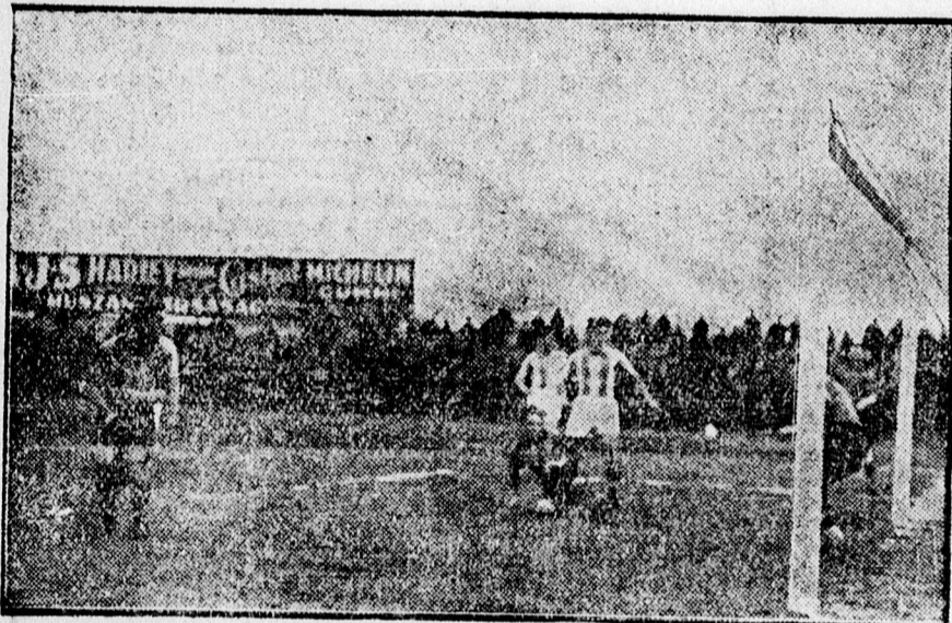
A Bocskay gólja.