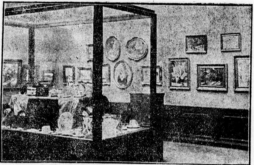
A Műpartoló Egyesület kiállításáról.