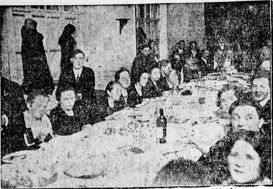
A vámspécsi Ref. Tanítótestület műsoros estjének batyus vacsorája.