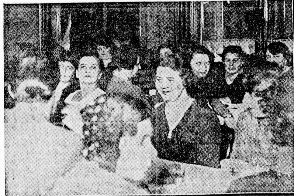
A Kálvinház tea-közönsége.

FEL NEM HASZNÁLT HELYSÉGEK A NAGYTEMPLOMBAN. Bemutatott ezután Uray egy