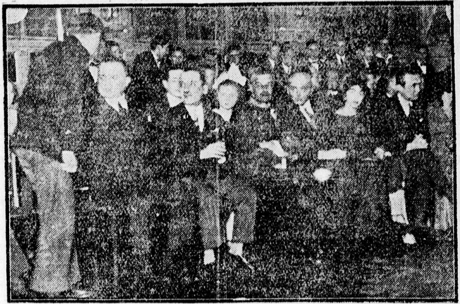
A vívóakadémia a közönsége.