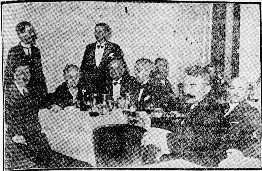
A vendéglős-bál rendező-bizottsága.