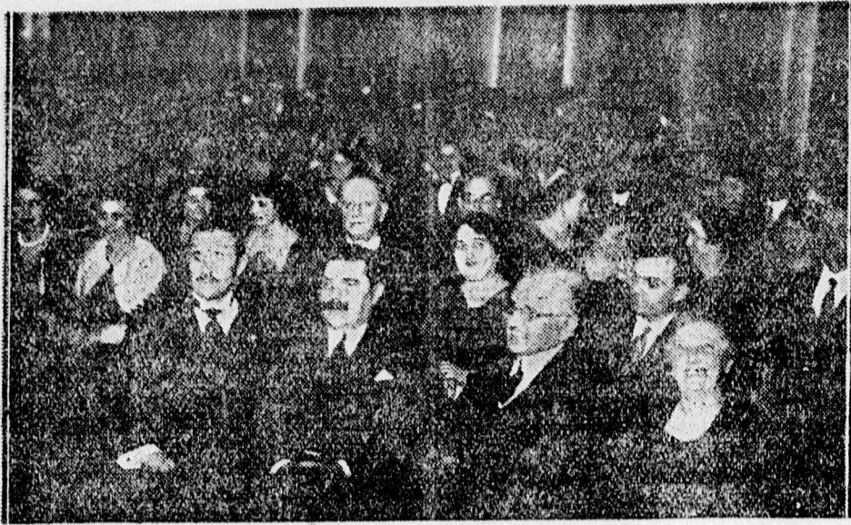
A hangverseny közönsége.