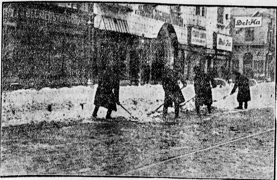
A frissen hullot hó — munkanélküliségély.