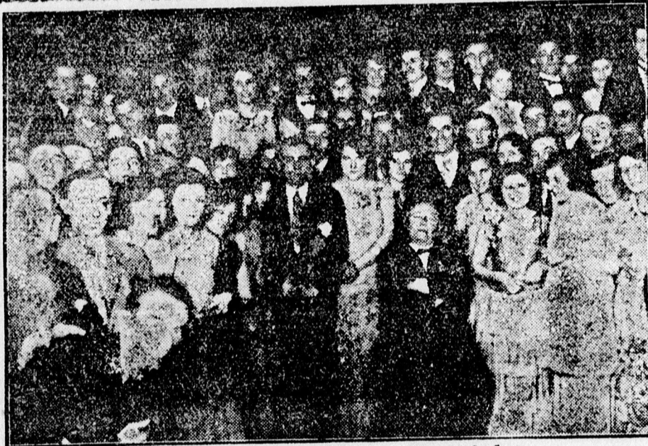
Az Iparos Dalegylet bálja a »Koroná«-ban.

Vásároljon a Debreczenben hűdítő cégek nál.