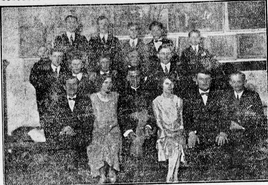
A görög kath. legényegylet teastélyének rendezői és szereplői.

Az árveréssel kapcsolatban említett korlátozások a csődeljárás keretében is érvényesek. Ezt a körülményt a csődnyújtási kérvény elintézésénél is figyelembe kell venni.