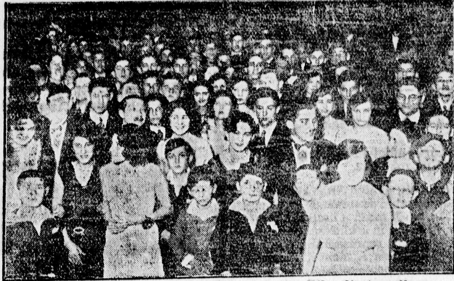
A zsidó gimnázium purim-estje az Arany-Bika disztermében.

JAVITÁS SZAKSZERŰEN ES GYORSAN. SINGER VARROGEP RÉSZV. TÁRS. Debrecen, Plac-utca 79. sz.