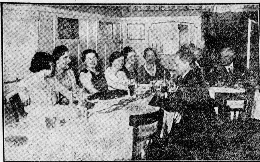
Turista-bál a Gambrinus-ban.