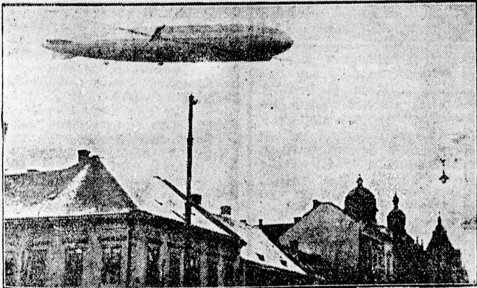
A Zeppelin megjelenik a város felett.

bugás hallatszott messziről és egyszerűen egy kiáltás lett urrá a várososn: