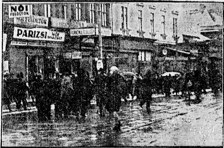
Szaladnak a Piac utcán a Zeppeli után.

Budapestről Miskolc felé vette irányát a Zeppelin, aztán a Hortobágyon keresztül Debrecen felé közeledett. Az Alföldön tomboló hóvihar uralkodott s a Zeppelin kormányosainak ugyancsak dolgot