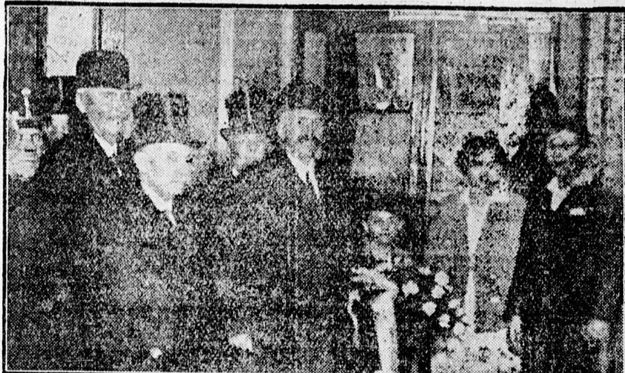
Kesserü törvényszéki elnök és Mező ügyészségi elnök gyermekei virágcsokrot nyújtanak át az igazságügyminiszternek.