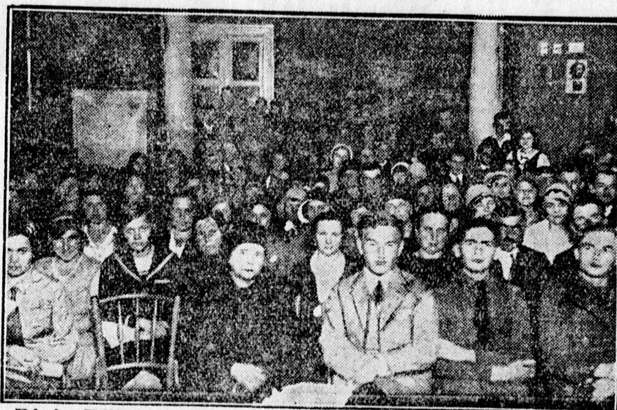
A »Révész Bálint« cserkészcsapat zászlóavatási ünnepének közönsége.