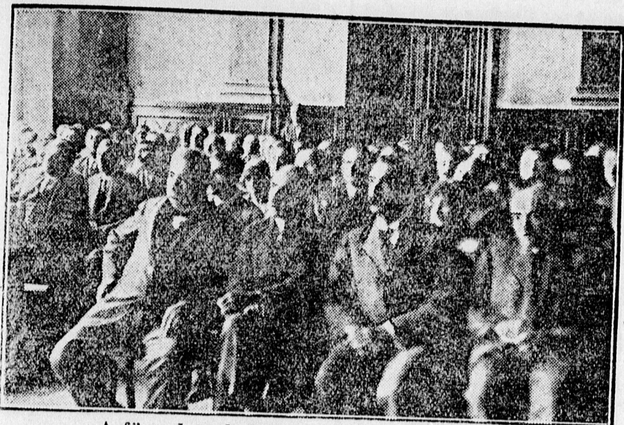
A fűszerkereskedők gyűlésének közönsége.