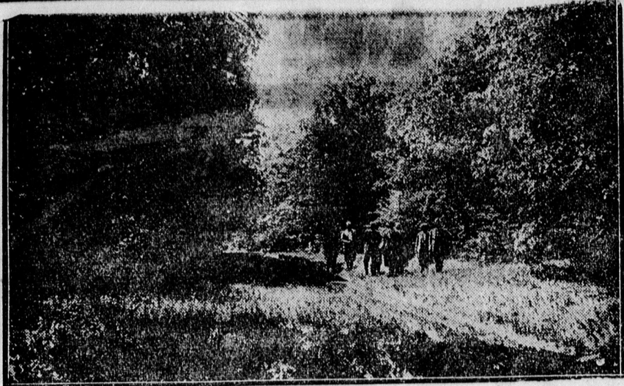
Részlet a gúthi erdőből.