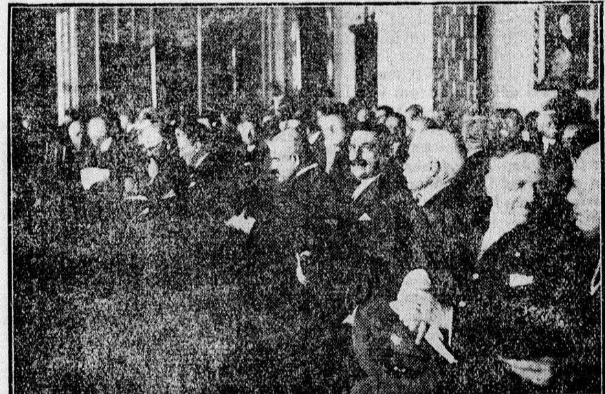
Az Országos Református Tanár egyesület közgyűlésének közönsége.

mindig azt hirdette, hogy a református tanárságnak csak az egységes magyar nemzeti műveltség lehet az ideálja.