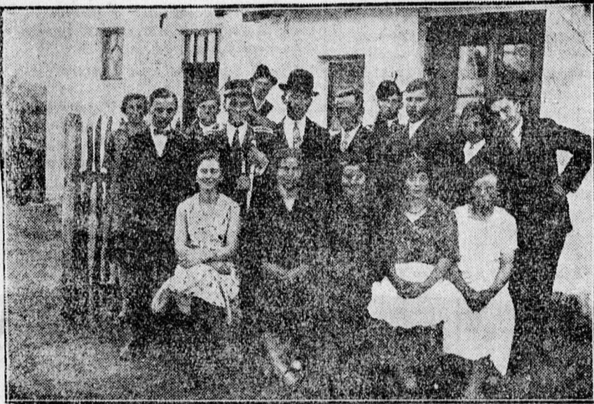
A Haláp—Hármashegyen tartott majális műsorának szereplői.