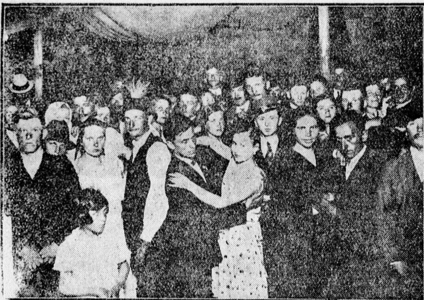
A Haláp—hármashegy majális közönsége.