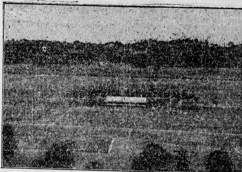
A debreceni dalárdák hangversenye a DEAC pályán