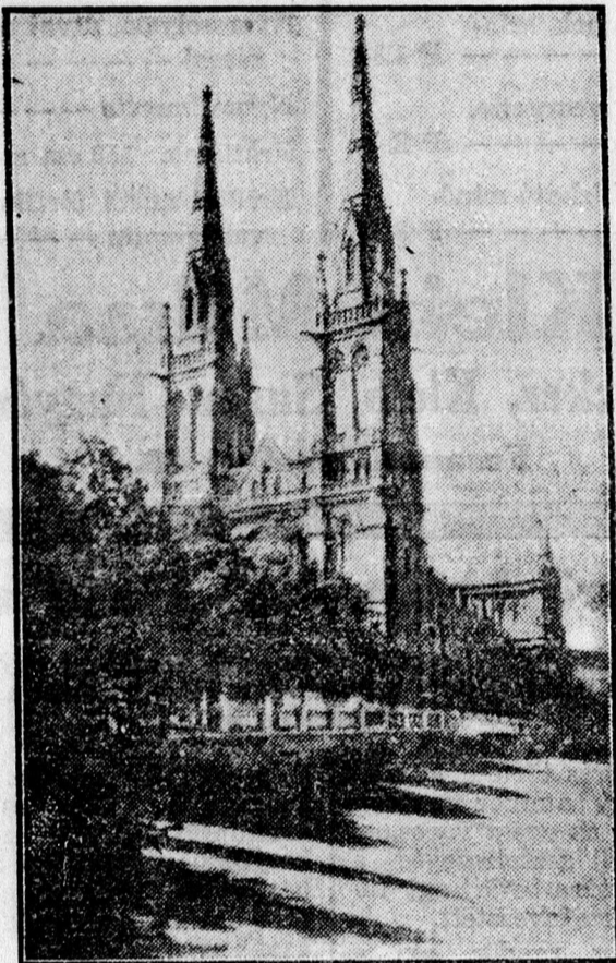
A János templom, ahol a kongresszust megnyitották.

Vasárnap délután néhányan főpróbát tettek az utból. A közeli Brigitta nevű félszigetről kis motoros esónakon jöttünk át Tallinba.