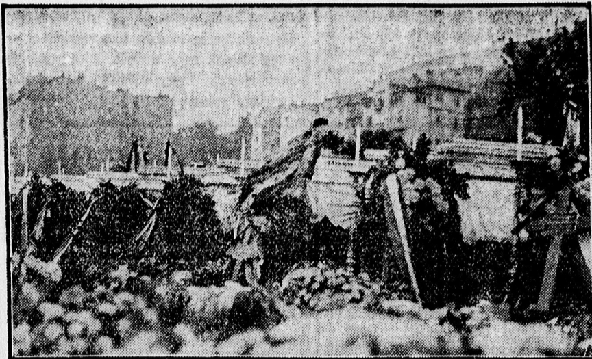
A felravatalozott koporsók.