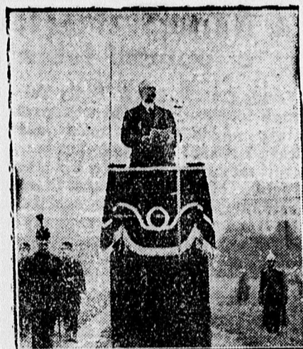
Zsitvay igazságügyminiszter gyászbeszédet mond.

— Teljesen kizártnak tartom, hogy a vidéki egyetemek közül akármelyiknek a megszüntetésére sor kerüljön. Ezekre az egyetemek-