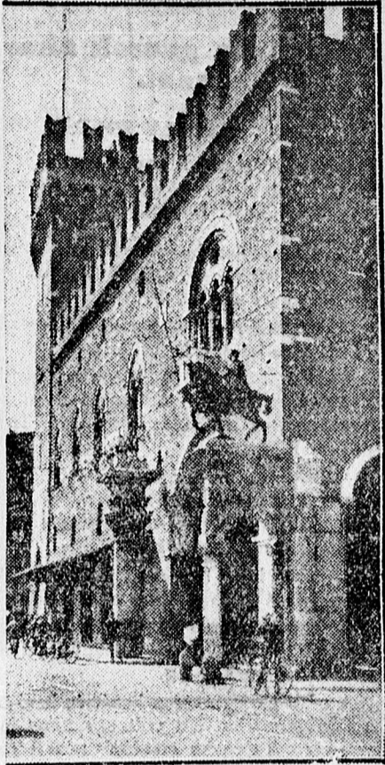
Ferrara. Palazzo Comunale.

lyok mellett elhaladva, Frizzivel együtt a nagyterembe léptünk és ennek hátsó részéből, ahová az asztalon pislogó két mécsvilág gyér fénye már nem hatolt el, végignéztük az ítélezést.