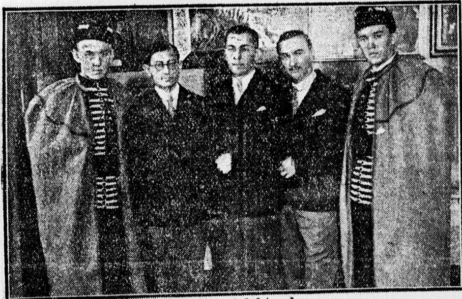
A felavatott új doktorok.