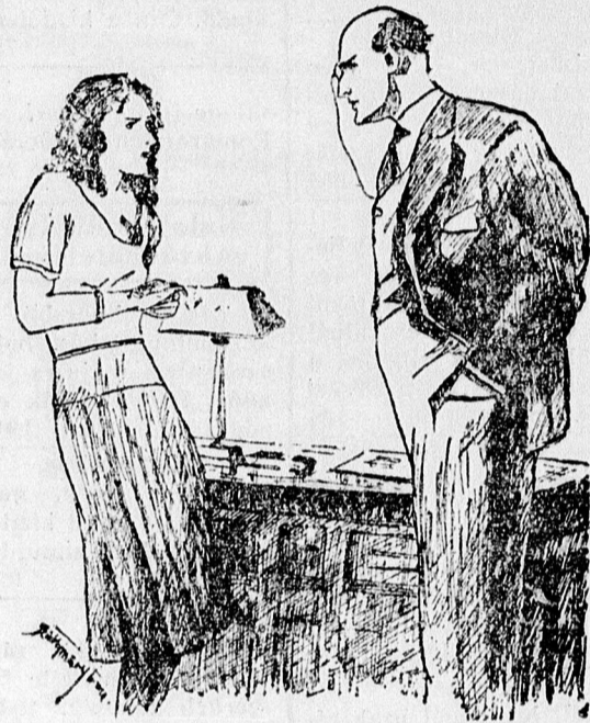
»En tisztességes leány vagyok.«

objektív mérlegelésével fogta fel a helyzetet. Egyáltalán nem lepődött meg, sőt az új fordulat növelte benne a vágyat.