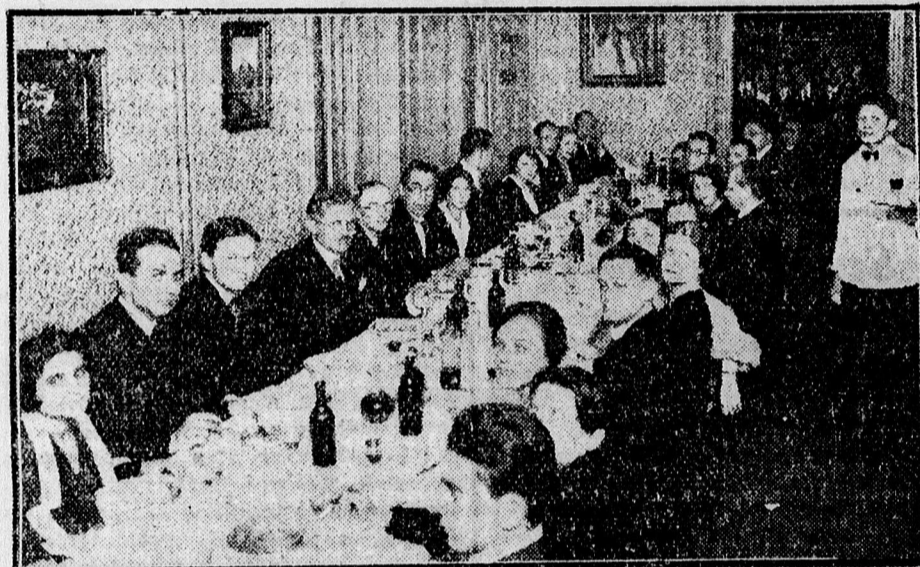
Az Ady-Társaság bankettjéről.