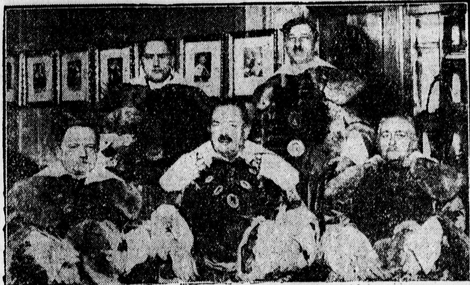
Az Egyetem tanácsa a tegnapi avatáson.

Az új doktorok palástban, illetőleg tógában jelentek meg az avatáson. (Cs. S.)