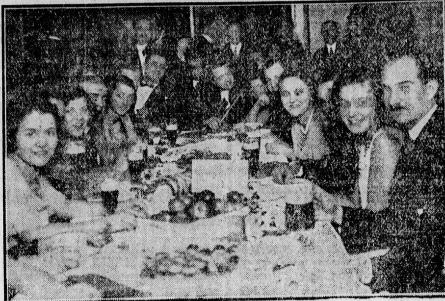
Csoportkép a „Lilla”-teáról.

illusztris közönséggel. Debrecen város társadalmának színe-java ott volt ezen az első „Lilla”-teán, amelyet a rendezőség az évad egyik legsikerültebb mulatságává avatott.