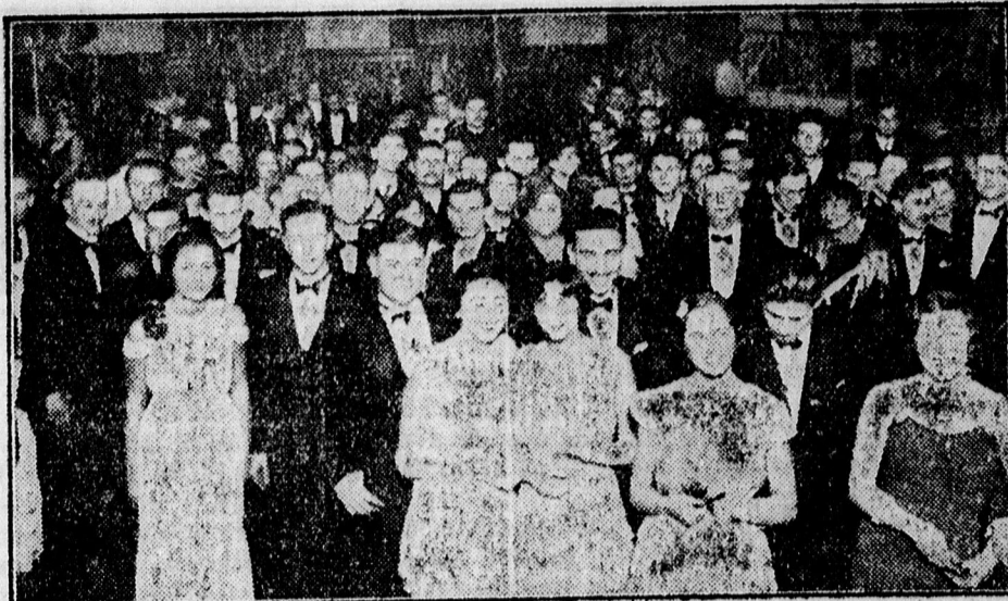
Az OMIKE bálról.