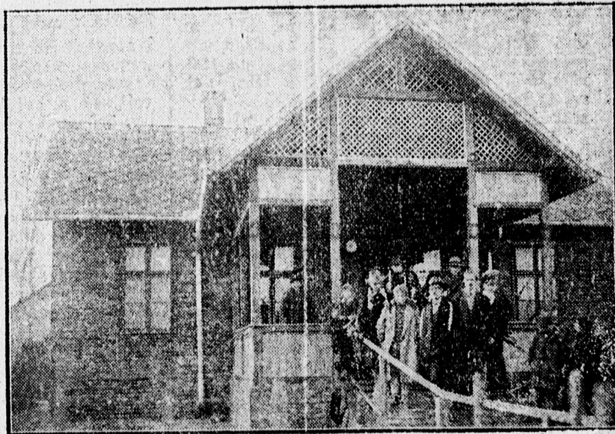
A csolnakázótavi melegedőház.

A város közönsége csak hálás lehet a cserkészeknek, akik fáradságot nem kimélve értékesítik a város áldozatkészségéből nekik jutott csolnakázótavat, mely most már úgy nyáron, mint télen elsőranguan betölti hivatását és sok ezer gyermeknek és felnőttnek szerez sok nemes örömet.