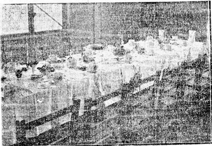
Ibolya asztal. II. díj.