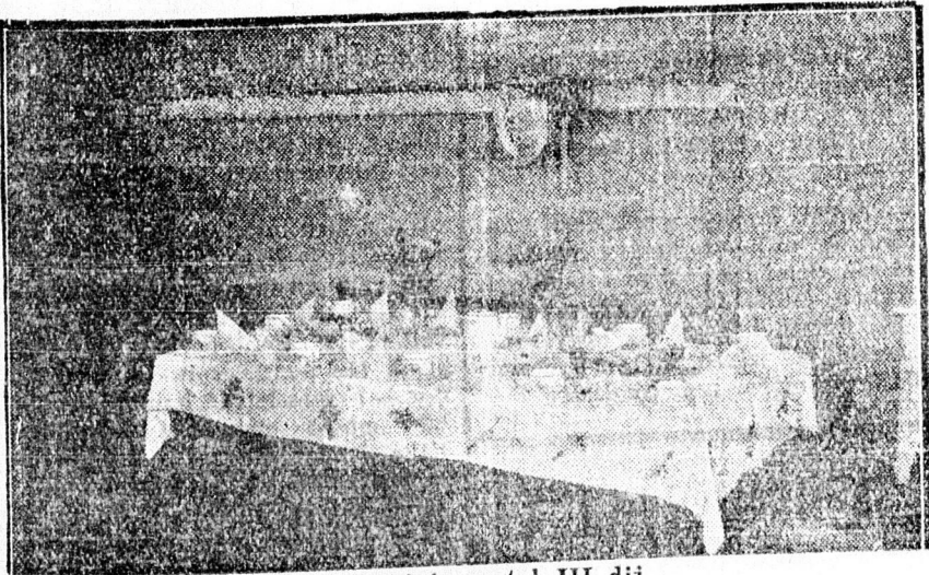
Buzavirág asztal. III. díj.