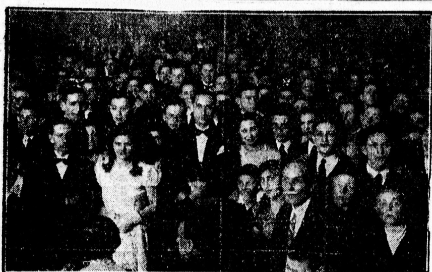
Csoportfelvételek a zsidó gimnázium purimi estjéről.