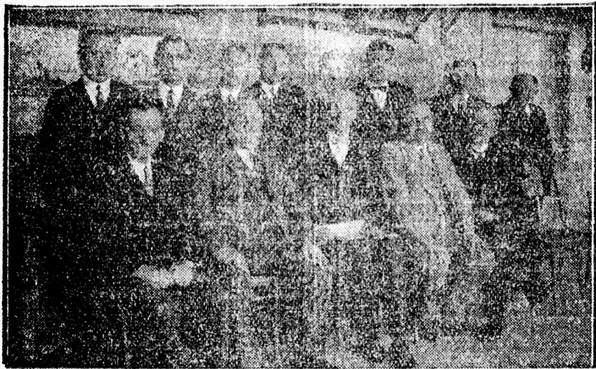
A tanfolyam előadói és a vizsgáztató bizottság.

megelégedéssel szemlélték az értékes munka eredményét, melyet a hallgatók felmutattak. Jellemző a fejlődés irányára, amelyet ezek a fiatal emberek elértek, hogy például nemcsak megtanulták, hogyan kell a logarlécet hánni, azaz számításokat végezni, de saját maguk készítették is ilyen logarlécet, továbbá megtanították őket arra is, hogyan kell több ismeretlennel bíró négyzetes egyenletet megfejteni. Ehhez az elméleti tudáshoz párosul a gyakorlati nagy tudások is, melyet itt szereztek.