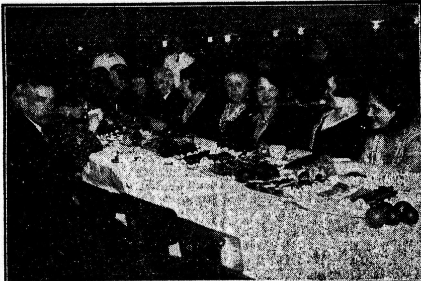
A MANSz tea estjéről.