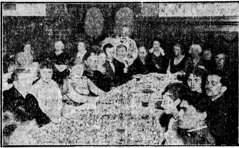
A Fülléregylet teastjéről.

— A Monti-Kör ma kedden este 8 óra 5 perckor magyartárgyú előadást fog tartani a római rádióban. Előadásában az olaszországi magyar légió szelleméről fog szólni.