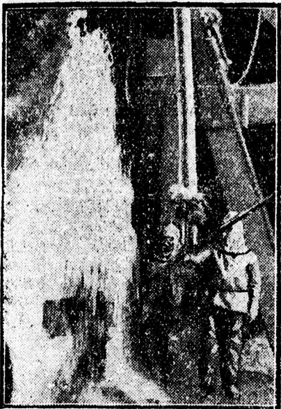
Ismét működik a debreceni gyógyforrás.

A Déri Muzeumban levő tárlat intézője különben az utolsó napokra tekintettel redukálta az árakat, hogy a kevésbé vagyonos közönség számára is megszerzhetővé tegye a Pállya-képek vásárlását és alkalmat adjon, hogy aránylag kis összegeket igazi műkincseket vásároljon. Azokat, akik már vettek képeket, kéri, hogy a mai nap folyamán a megvett képek elszállításáról gondoskodjanak.