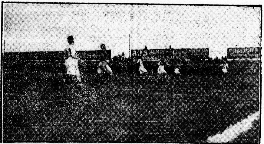
Kehut centeréz a Bocskai kapu elé.