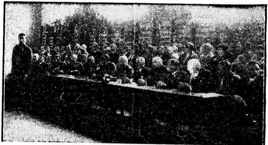
A ref. főgimnáziumban tartott ifjúsági vívóverseny közönsége.