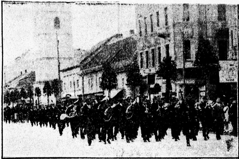
A MAV zene kara zenés ébresztővel járta be a várost az Anyák-napján.

Egész nap a város területén sok ezer anyáknapi jelvényt és levelezőlapot árusítottak. A csinos kivitelű jelvények nagyban megnyerték a közönség tetszését. Az élelmes KIE tagok már a kora reggel induló szegedi gyorshoz is kivitték az anyáknapi levelezőlapot.