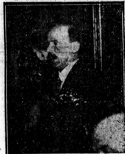
Bethlen István beszél az értekezleten.

melyből kicsendült az a tény, hogy ez az egyedüli módja az eladósodott termelési ágak megmentésének. Hasonlóan teljes nyíltsággal állást foglalt Bethlen a kamatrendük mellett s világosan kijelentette, hogy külföldi hitelezőink meg kell, hogy elégedjenek 4, esetleg 2 százalékos kamattal és a belső bankrátát is tovább csökkenteni kell. Ha a külföldi hitelezők nem hajlandók a megegyezésre, amit ugyan nem hisz, a magyar kormány nem riadhat vissza az egyedüli intézkedéstől sem. Zugó helyeslés mutatta, hogy Bethlen a közvélemény lelkéből beszél.