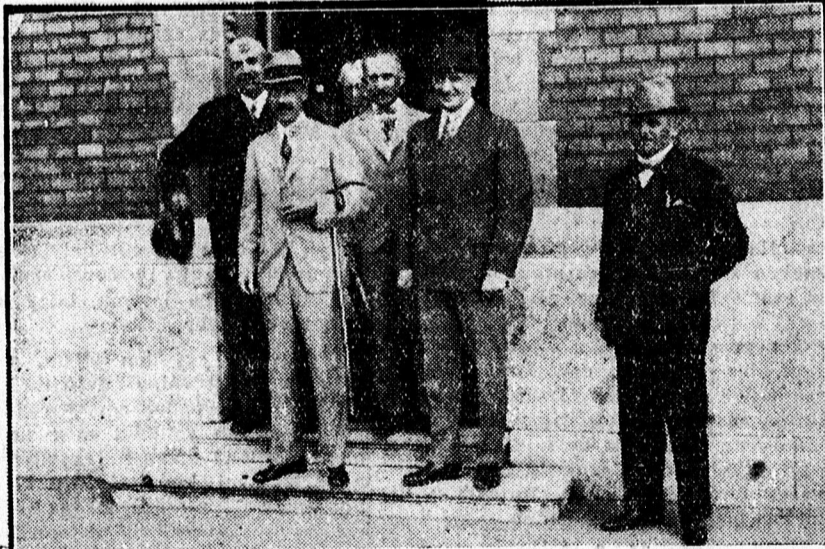
Bethlen István érkezése a pályaudvaron.

Nyíltan állást foglalt Bethlen István debreceni beszédében a devalorizáció mellett. Ha annak idején felállították a valorizáció lehetőségét, akkor most, az érték eltolódások idején jogos a devalorizáció követelése. Percekig zugott ezután a kijelentése után a taps,