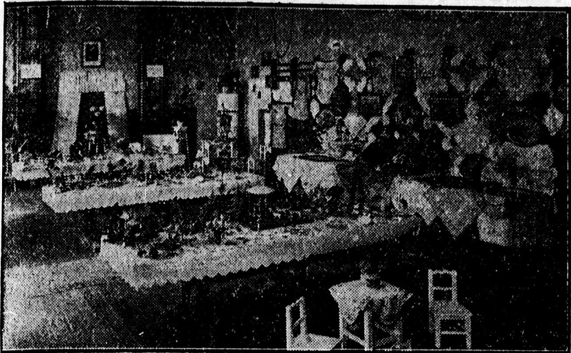
A siketnéma intézet növendékeinek kiállítása.