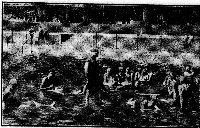
Akik „kint vannak a vízből”. (A gyógyulást keresők a hőforrás beömlésénél kúráznak.)