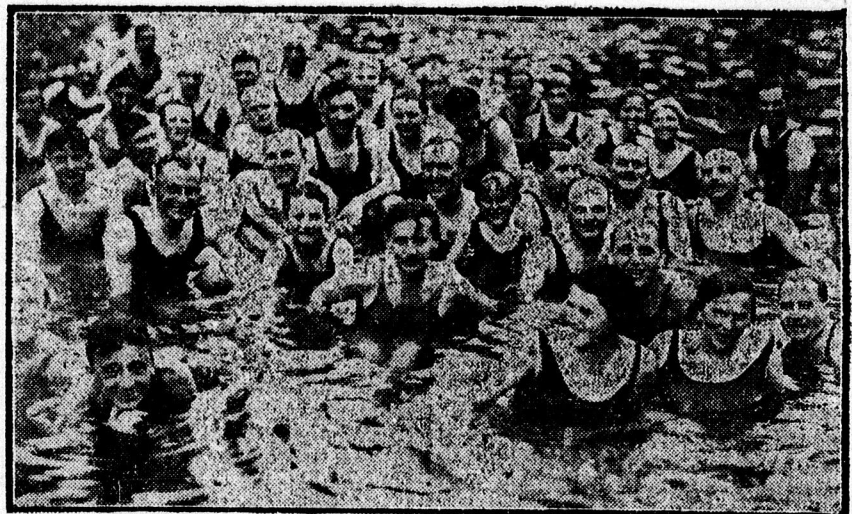
A fürdőzők egy csoportja a fényképezőgép előtt.