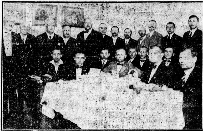
Csoportfelvétel a pincérszakiskola záróvizsgájáról.

intézték kérdésekre meglepően jó és biztosan feleltek. Az idők jele, hogy a német és francia nyelvből is kaptak oktatást. A megjelent vendéglős iparosok teljes elismeréssel nyilatkoztak a tanulók elméleti szakképzettségéről és melegen gratuláltak az elért eredményért Pólszter igazgatónak.