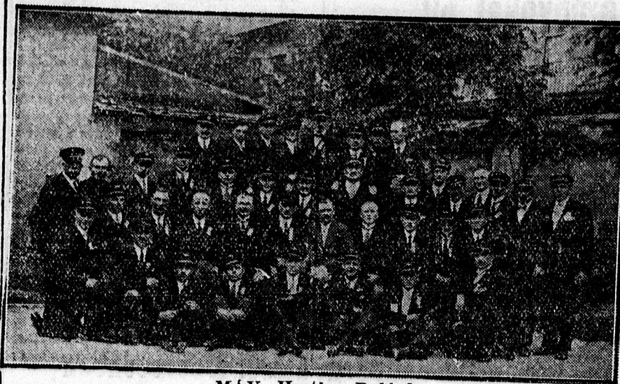
MAV »Horthy« Dalárda.

Oda- és visszautazásra is jogosító villanyosjeggyel együtt 1 pengő 20 fillér.