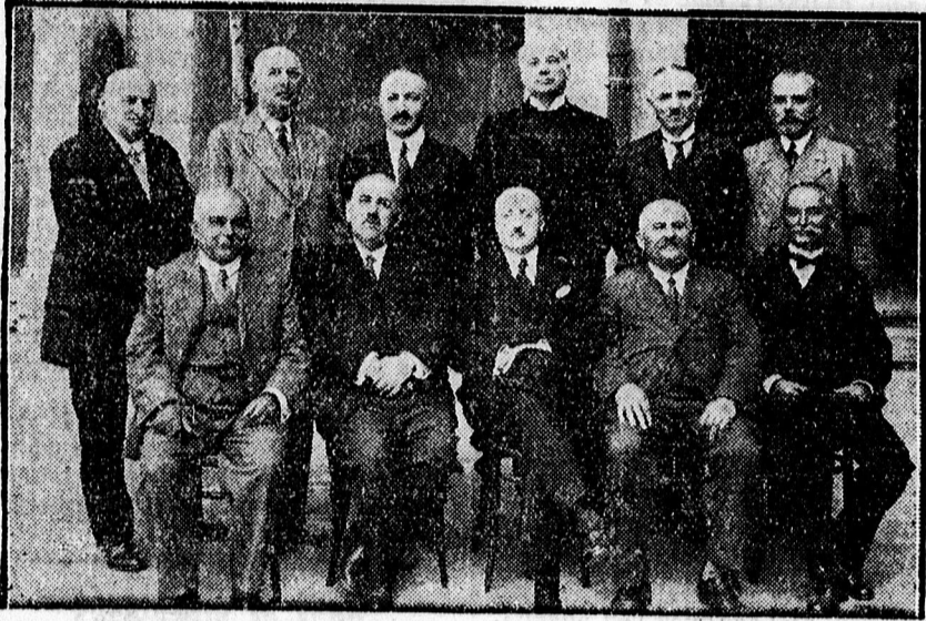
A 40 éves érettségi találkozóra összegyűlt öreg „diákok”.