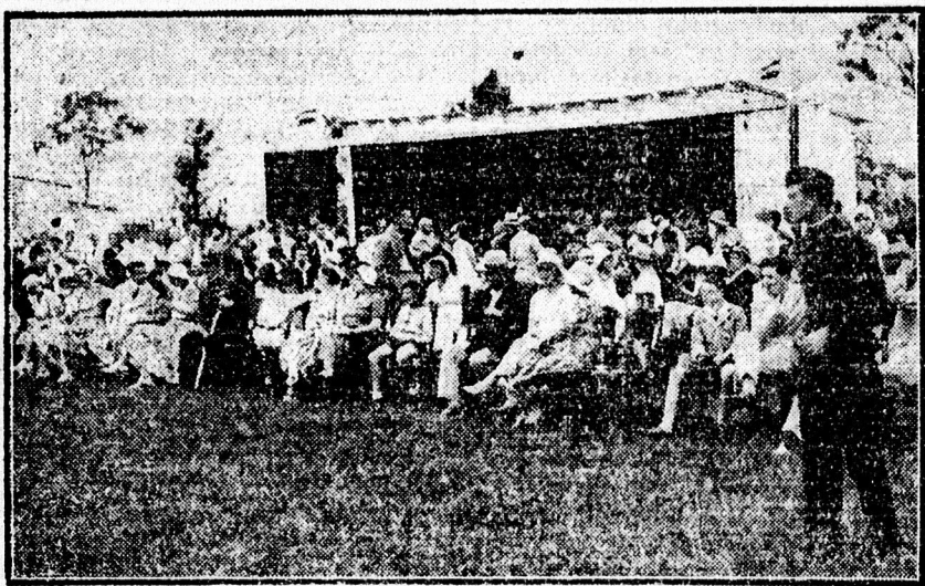
A repülőnap közönségének egy része.