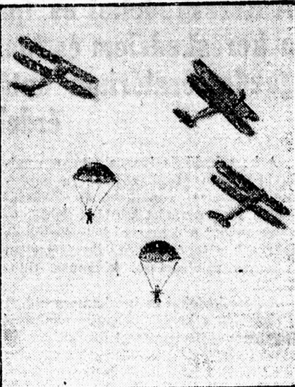
Bábukat dobnak ki ejtőernyővel a repülőgépekből.

A közönség a pilótanövendékek nagyszerű munkájától elragadtatva, igen kellemes benyomásokkal távozott el a repülőtérről.