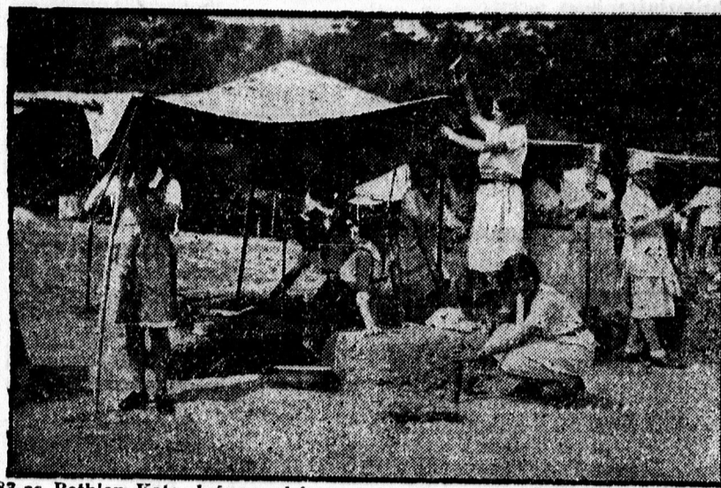
A 83-as Bethlen Kata leányescrész csapat táborigényes konyhájának készítése.