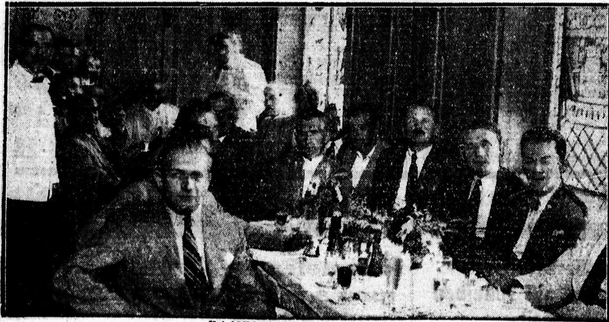
Felvidéki gazdák társaságában.