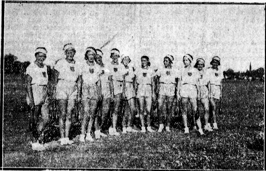
A DTE női tornász mintacsapata a sportversenyen.

— Teljes tudatában vagyok annak, hogy főként az állami elemi iskolai tankönyveket három tényező drágítja: az egyik az indokolatlan és mesterségesen megnövesztett terjedelem, második a fényűző kiállítás, harmadik pedig az a körülmény, hogy a legutóbbi időkhöz képest a tankönyvek túlságosan rövid időközökben változtak. Ezért tehát az állami és államilag kezelt iskolákra nézve tervbe vettem, hogy már most elrendelem a tankönyvek egységesítését, más szóval az összes állami és államilag kezelt iskolákra nézve a tényleges szükségletnek megfelelő terjedelmű, kiállítású tankönyvek kiadását és egyidejűleg igyekszem majd hasonlóan célravezető intézkedésekre bírni a hitvallásos iskolák egyházi főhatóságait, hogy a szülők jogos panaszai orvoslást nyerjenek.