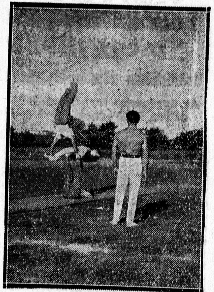
A DTE minta-tornászcsapata a helyőrségi sportünnepélyen.

Megkapó, de amellet még kis mé-reteiben is az igazi harc minden fé-lelmetes szépségét meglevenítő volt a harcbeutató. Tüzérségi, gép-puska, bomba és gáz előkészítés után a gyalogság rohamra ment az ellenséges állás ellen és mögöttük felvonultak a féelmetes tankok — sajnos, csak vászonból. Az igazi tan-kokat megtiltotta Trianon. Az illu-zió azonban így is teljes volt és a harc játék valóságos lenyűgözte a közönséget.