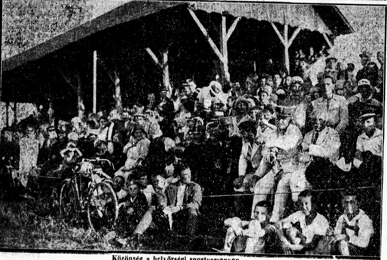
Közönség a helyőrségi sportversenyen.