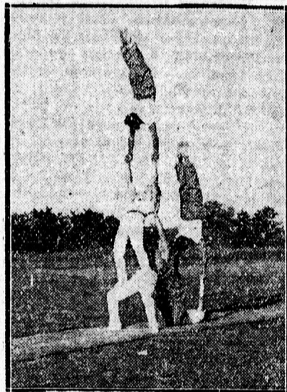
A férfi tornászok gulája.