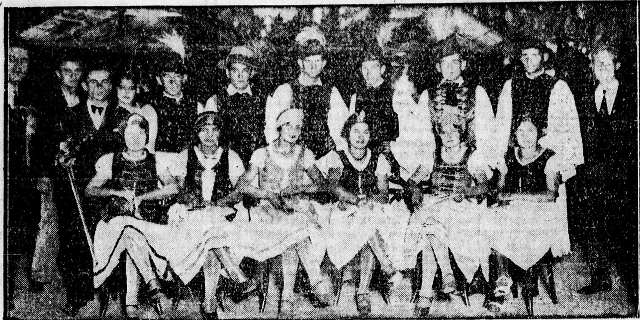
Csoportkép a vargakerti ifjúság szüreti mulatságáról a Rózsabokorban.