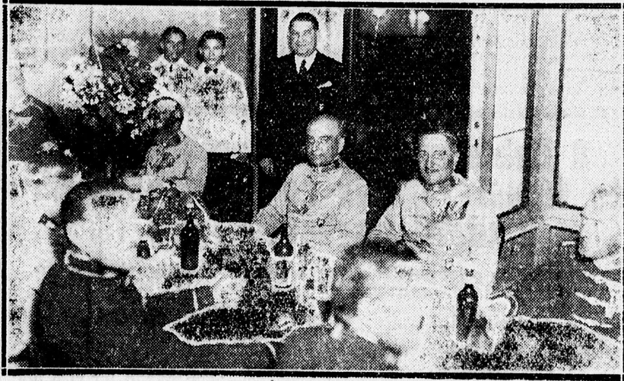
Középen Siposs altábornagy, mellette jobbról vitéz Bartha tábornok.

A kíséretében levő szárnyesgédje ezután szintén odanyujtotta kezét az csikósnak, ellenben a hortobágyi csikós ekkor helyére illesztette kalapját, sercint egyet és félrefordul. Azt kérdi a fenséges ur, hogy hát „Öreg, tulajdonképpen kivel szokolt maga kezét fogni?” A csikós erre azt mondta: