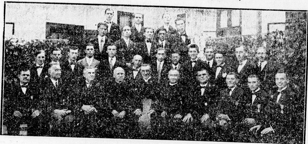
a gör. kath. Legényegylet tagjai első sorban a kitüntetett tagokkal.