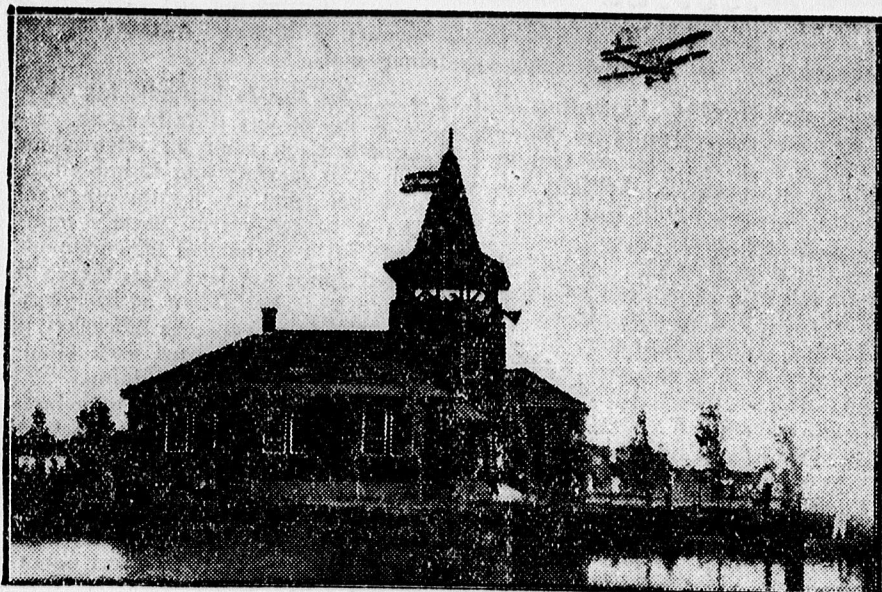
Az új cserkészház körül repülőgép kering.