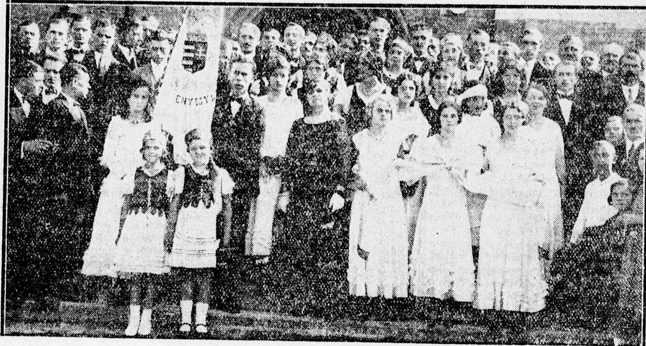
A gör. kath. Legényegylet a zászlószentelés után a templom előtt.