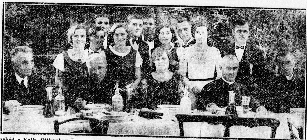
Közében a Kath. Otthonban.