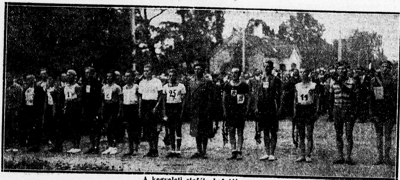
A kegyeleti staféta befutól.

Iszapkezelések, szénsavasfürdők, oxigénfürdők, vizgyógyászati kezelések, diathermia, villanykezelések villanyfürdők, quarcfénykezelés, zanderkezelések.