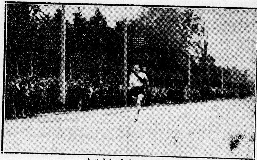
A győztes befut a célhoz.

Budapest, okt. 6. A Magyar Atlétikai Szövetség csütörtökön délután rendezte a IX. Névtelen Hősök Stafétáját, 92 egyesület, illetőleg csapat nevezett a versenyre s közülök 77 csapat indult. A verseny a Vérmezőn kezdődött, végül a Hősök Emlékműve volt. Az útvonalon nagyszámu közönség nézte végig a versenyt. Ott volt OTT, a székesfőváros, a sportegyesületek s sportszövetségek képviselője, a honvédség és csendőrség tisztikarának számos tagja. A Hősök Emlékműve körül a frontarcosok állottak díszőrséget. A célba elsőnek az MTK futója érkezett kb. 50 m-es előnnyel, 16.28 perces idővel. A