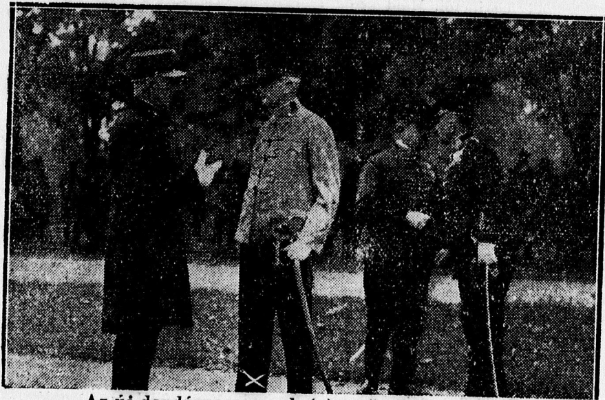
Az új dandárparancsnok (x) az ünnepélyen. (Burg J. felv. Pannonia udvar).

— Az idősebb generációra, akik túlélték a világháborút, a megpróbáltatásokat — mondotta a rektor magnificus — a fiatal generációra egy óriási feladat vár. Helyre kell hoznia, amit mások elrontottak, s vissza kell szerezni, amit elvesztettünk. Nem elég az erő, nem elég az ép test, nem elég a bizonyos ideig