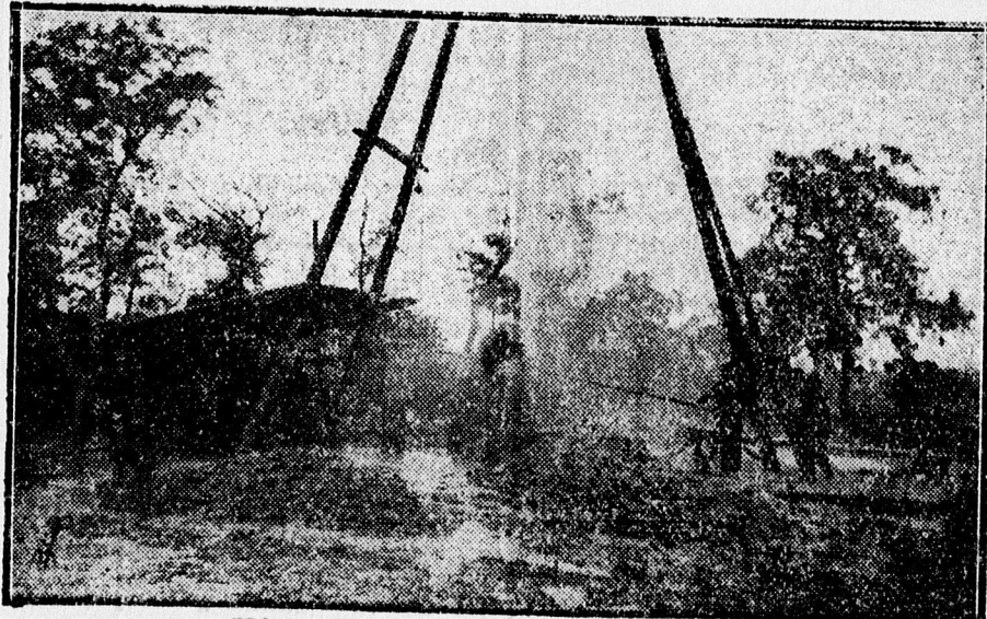
Képek a hortobágyi gázkitörésről.

Alig hagyták el a gépkocsik a Kadaresi csárdát, mintegy 5—6 kilométernyire a hortobágyi csár-