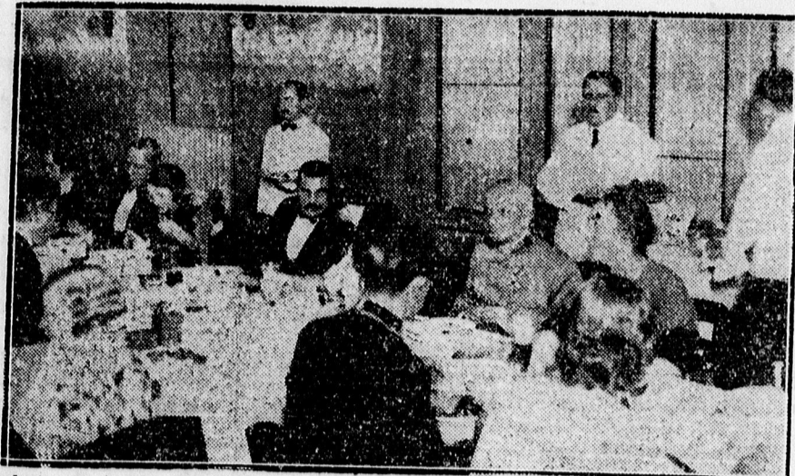
(Burg Fotó Pannonia udvar.)