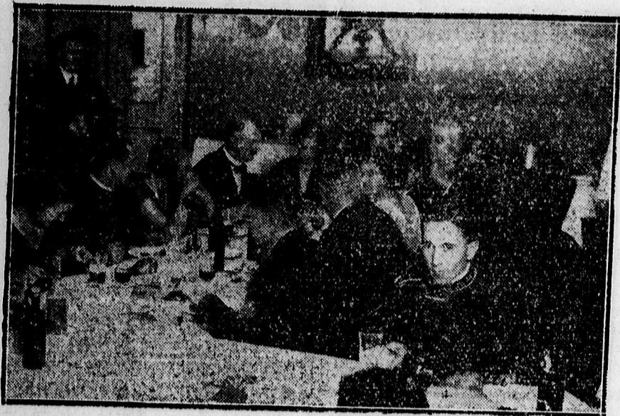
Az olimpiai vívók tiszteletére rendezett bankett az Arany Bikában.