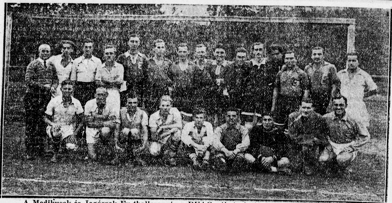
A Medikusok és Jogászok fu tbalcsapata a DEAC pályán lejárt szott meccs után. — Győzött a Jogászok csapata 2:0 arányban.

x Gabányi gyapjuszövetei igazán nagyon olcsók és jók. Bádogos 2.