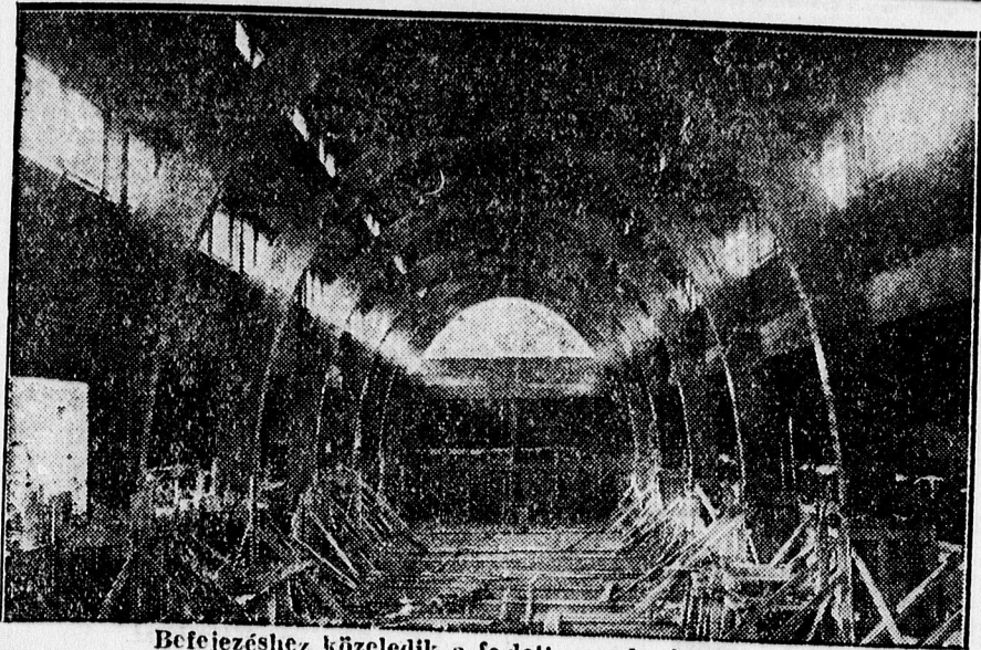
Befejezéshez közeledik a felett uszoda építése.