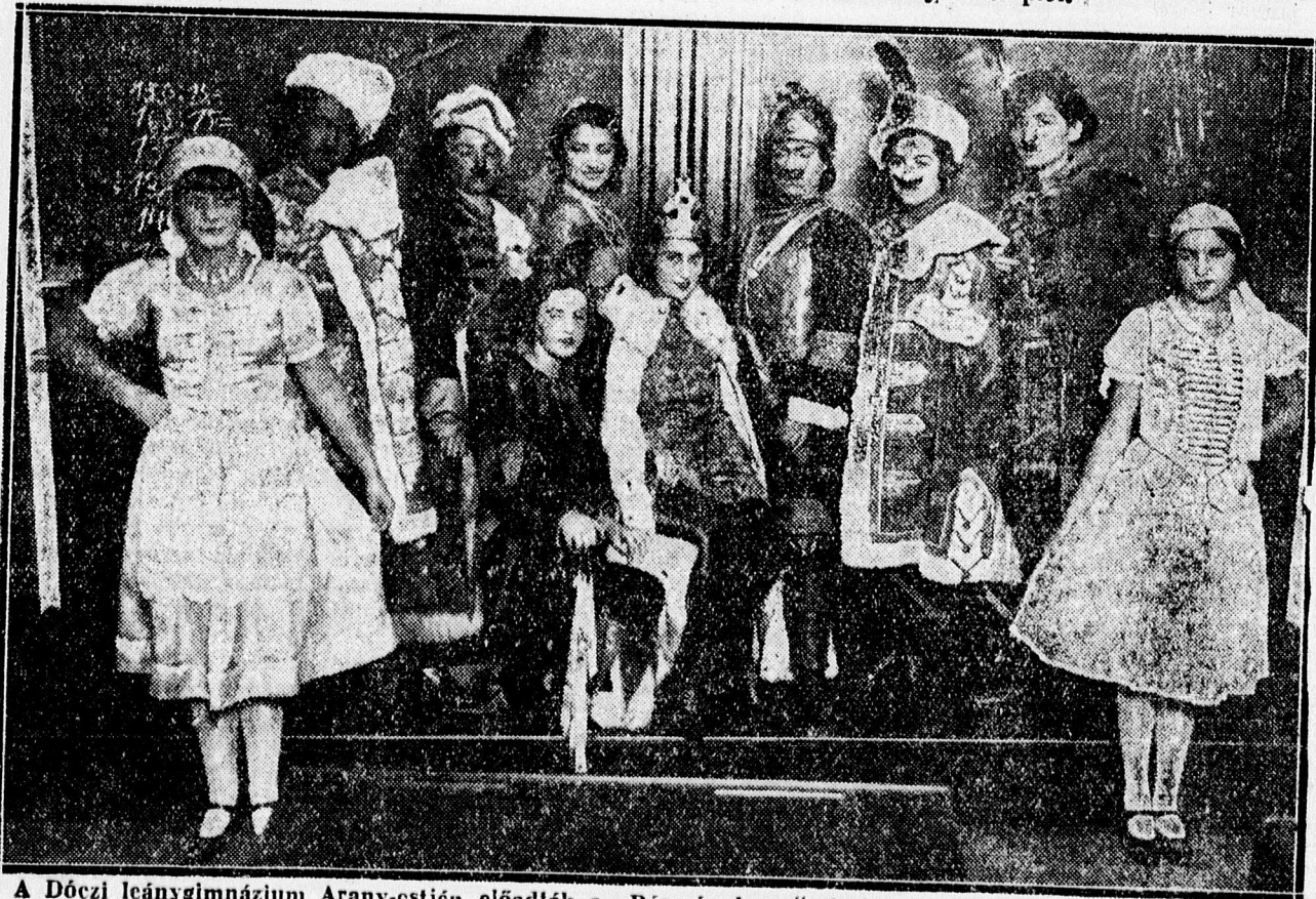
A Dóczy leánygimnázium Arany-estjén előadták a »Pázmán lovag«-ot. A darab szereplői.