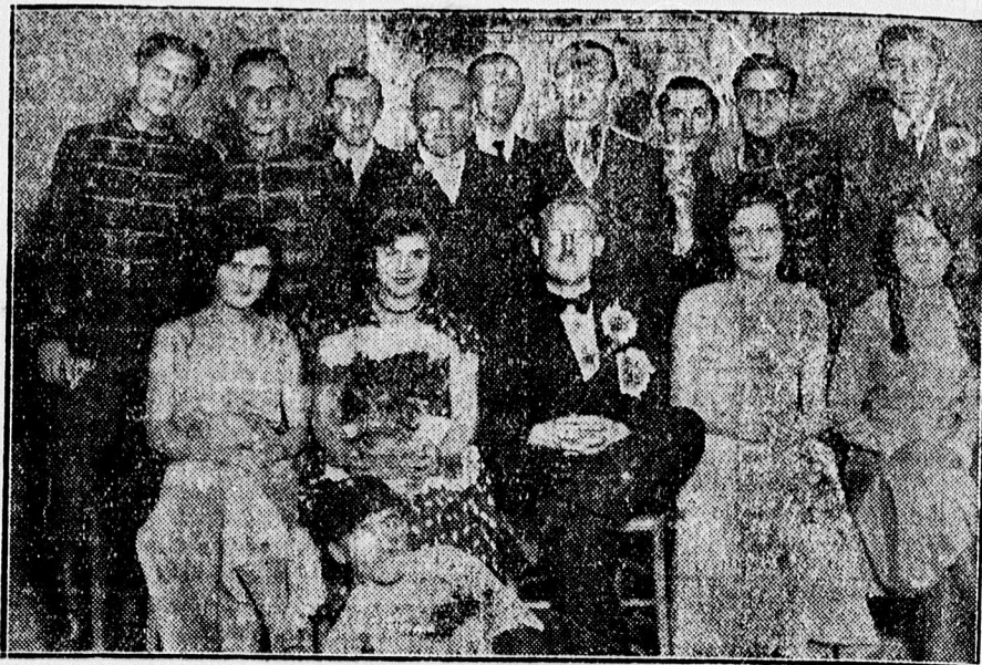
A Katolikus Népszövetség által rendezett kulturdélután szereplői.