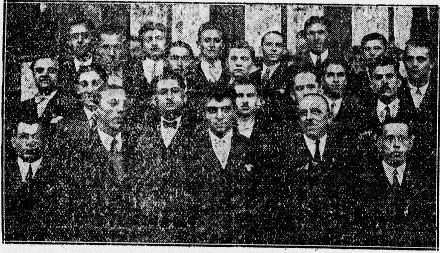
A Munkásotthon kulturdélutánjának szereplői.