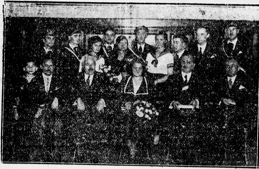
A Boeskaibajfarsói egyesület nagysikerű műsoros estjének szereplői.