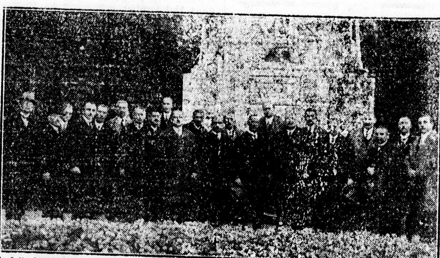
A középiskolai tanárkongresszuson résztvevő tanárok egy csoportja megkoszorúzza a hősök emlékművét.

— Az iskola válsága abban van, hogy a növendék nincs a kezében az iskolának, mert a növendék nem tudja átengedni magát az iskolának. A család, a közélet, a közszellem nem alkalmas arra, hogy az iskola nevelő erejét