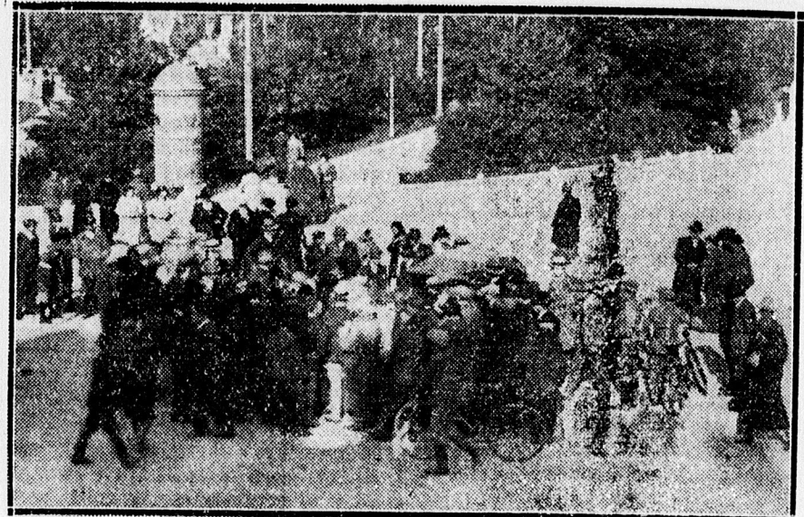
A Bika előtt összeültözött egy autó és bicikli. Percek alatt összefutnak a járókelők a helyszínen.