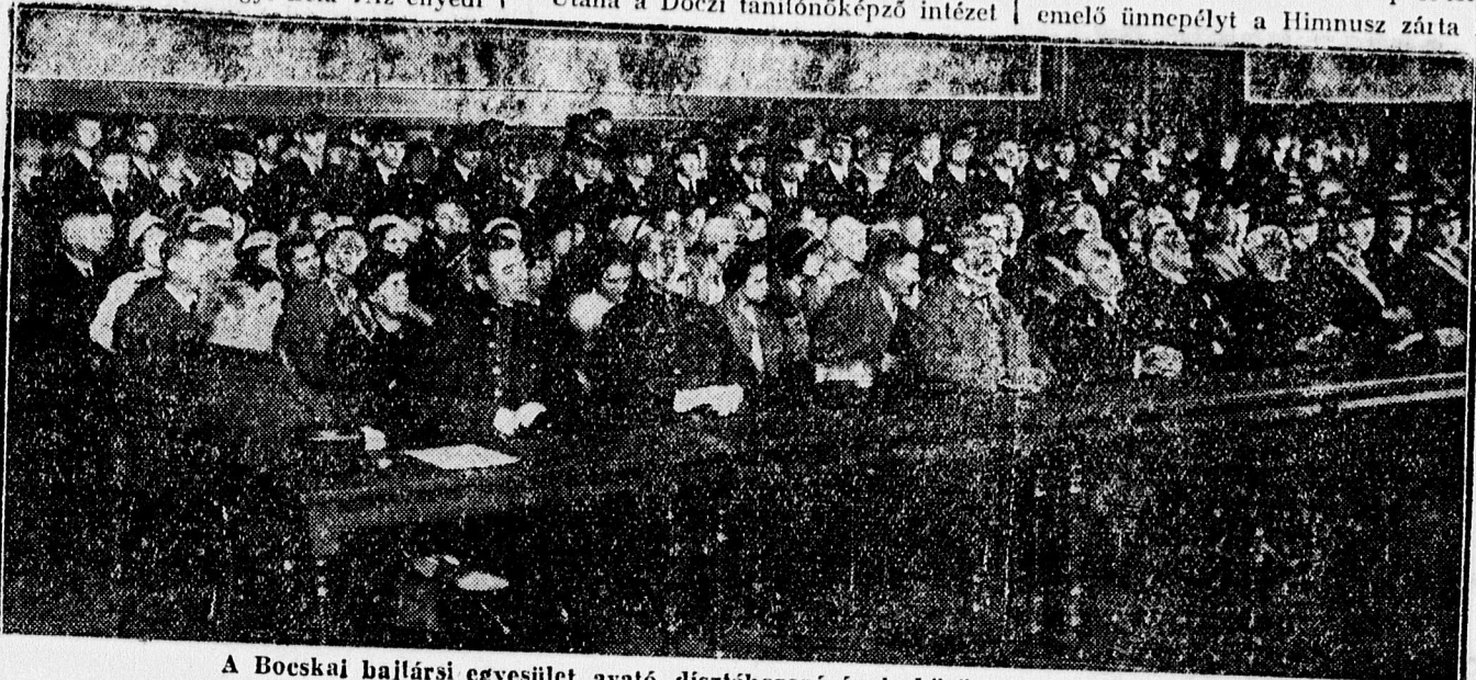
A Bocskai bajtársi egyesület avató disztáborozásának közönsége a vármegyeházán.